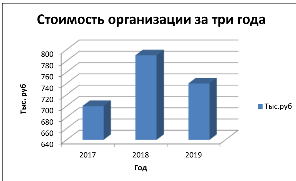
Рисунок 3 – Стоимость организации ООО «Ветер перемен» за три года

Стоимость организации ООО «Ветер перемен» на рынке за три года представлена на рисунке 3.