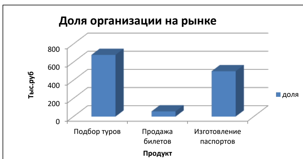
Рисунок 4 – Доля рынка организации по трём типам продукции

Построим диаграмму, наглядно отражающую данные по занимаемой доле на рынке организацией ООО «Ветер перемен» на рисунке 4.