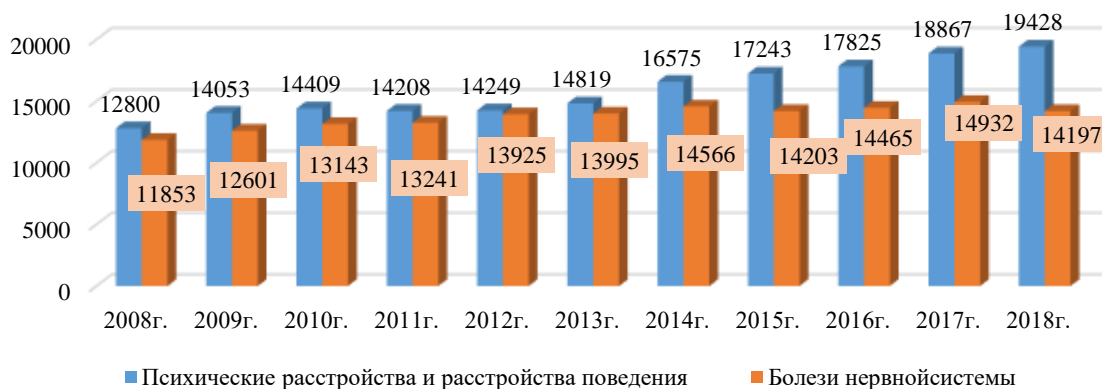
Рисунок. 3. Динамика основных причин детской инвалидности за период 2008-2018 гг.

Так, по данным рисунка 3 можно видеть, что ещё в 2008 году детей с психическими расстройствами и расстройствами поведения в России насчитывалось 12800 тыс.чел., в 2013 году – их число возросло на 15,77% и составило 14819 тыс.чел., а в 2018 году по сравнению с 2013 годом их число увеличилось на 31,101% и в абсолютном выражении составило 19428 тыс.чел. Если же сравнивать 2018 год с 2008 годом, то можно увидеть «плачевную» картину, так как детей с этим диагнозом увеличилось на 50%.