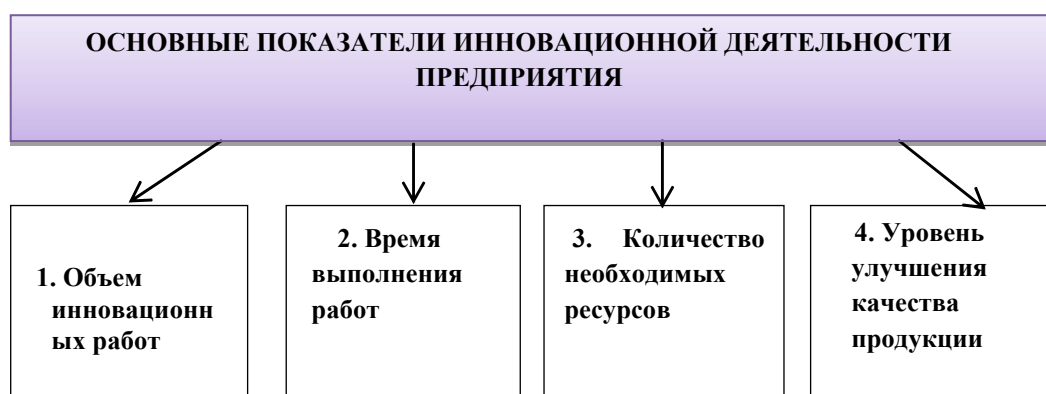
Рисунок 3 – Основные показатели инновационной деятельности предприятия

Качество рабочей силы оказывает большое влияние на успешность и эффективность выпуска того или иного продукта предприятия. На рисунке 3 укажем показатели, которые будут определять инновационную деятельность предприятия.