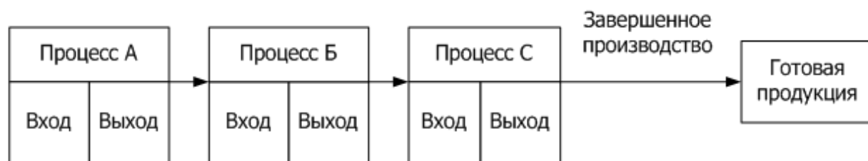
Рисунок 2. Схема по процессного калькулирования

В общем виде по процессный метод учета затрат и калькулирования себестоимости может быть представлен в следующем виде (рисунок 2).