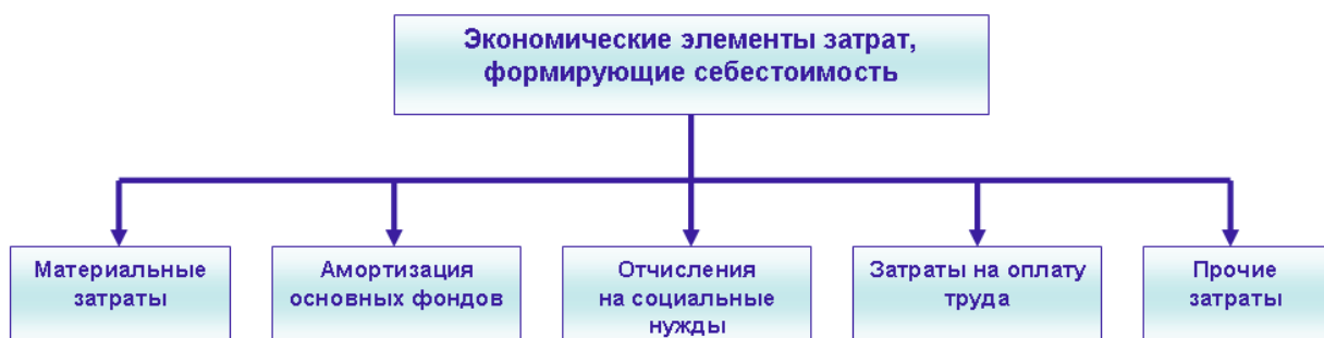
Рисунок 3. Группировка расходов по обычным видам деятельности по элементам затрат

Определение расходов от обычных видов деятельности и порядок их признания изложен в положении по бухгалтерскому учету ПБУ 10/99 «Учет расходов». При формировании расходов по обычным видам деятельности должна быть обеспечена их группировка по следующим элементам (рис.3).