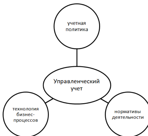
Рисунок 1 - Схема генерации управленческого учета

В то же время создание в организации системы управленческого учета практически невозможно без правильной классификации процессов и технологий в соответствии с систематикой управленческого учета, что позволит выработать правильную методологию учета затрат, определения результатов деятельности подразделения, да и наконец, просто определения системы управленческой отчетности подразделения. Схема генерации управленческого учета представлена на рисунке 1.