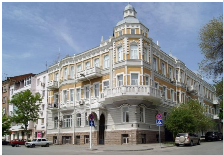
Рисунок 2. Дом Ивана Зворыкина, Ростов-на-Дону

Дом имеет три надземных этажа и один цокольный этаж. Единый архитектурно-художественный облик фасадов определяют формы оконных проёмов, эркеры и раскреповки. Формы окон на каждом этаже отличаются: на первом и третьем этажах верхние углы окон скруглены, на втором и цокольном этажах имеют обычную прямоугольную форму. Первый и цокольный этажи имеют рустовку. Из элементов готики в оформлении здания присутствуют фриз с трёхчетвертинными колоннами, декоративные кокошники над окнами первого этажа. Фасады здания увенчаны аттиками со стрельчатыми нишами. Парадный вход имеет форму стрельчатой арки. Угол здания подчёркивается шестиугольным эркером, обрамлённым балконом на уровне второго этажа и увенчанным башенкой с куполом [2].