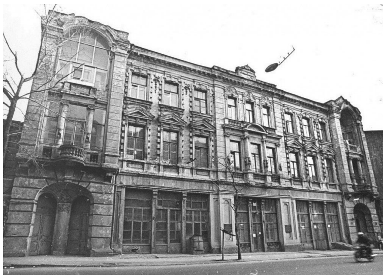
Рисунок 3. Доходный дом наследников В. Р. Максимова, Ростов-на-Дону

Здание построено из кирпича, фасад был оштукатурен и имеет светло-бежевый цвет. У дома очень яркий архитектурный облик благодаря большому разнообразию декора. Сам фасад симметричен, это подчеркнуто центральной раскреповкой увенчанной сложным аттиком и раскреповками с глубокими полуциркульными нишами в первом этаже. На первом этаже с двух сторон расположены боковые входы в квартиры, по центру расположена общественная часть, выделенная большими витринными окнами.