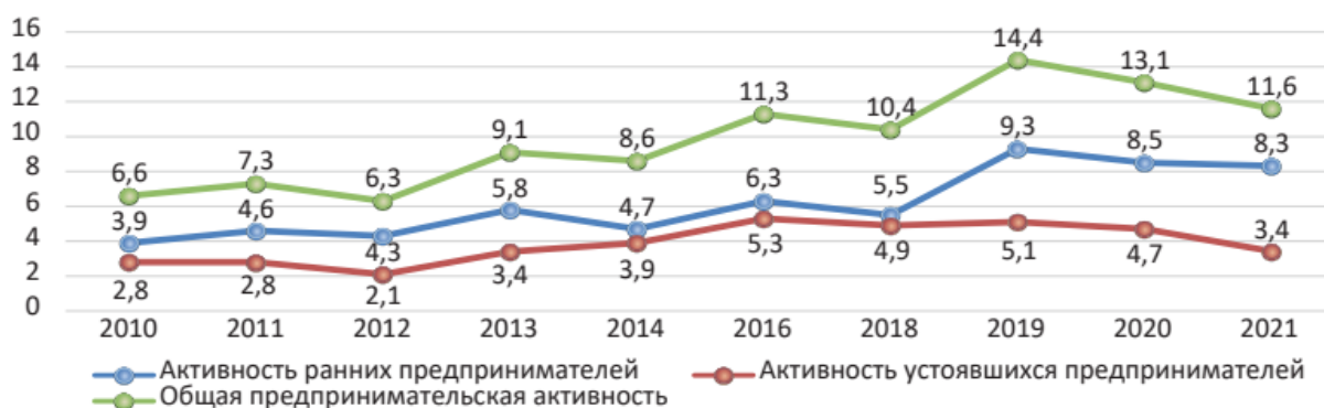
Рисунок 2 — Уровень предпринимательской активности в РФ[6]

На рисунке 2 рассмотрим данный показатель в разрезе нашего государства. Самый пик пришелся на 2019 г., когда каждый 20-й гражданин был так или иначе вовлечен в процессы малого бизнеса. Однако пандемия, банкротство компаний и сокращение реальных доходов населения достаточно сильно снизило уровень предпринимательской активности — она сократилась с 9,3% до 8,3% для лиц, которые только начинают организовывать бизнес или собираются это сделать и с 5,1% до 3,4% для уже устоявшихся бизнесменов.