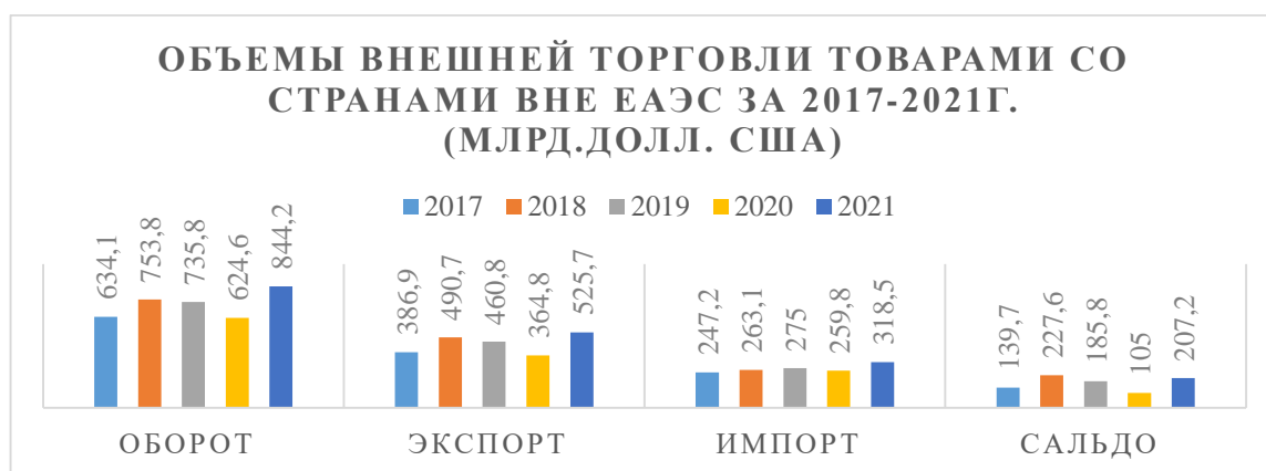
Рисунок 2 – Объемы внешней торговли товарами со странами вне ЕАЭС за 2017-2021г. (млрд.долл. США)

На рисунке 2 изображены объемы внешней торговли товарами со странами вне ЕАЭС за 2017-2021г. графическом виде