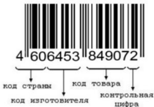
Рисунок 1 - Штриховой код [6, с.87]

Штриховой код представляет собой вид информации, наносимой на упаковку товара, и дающей представление об основных свойствах того или иного товара. (см. рисунок 1)