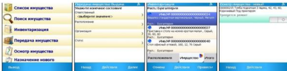
Рисунок 4 - Мобильный клиент [9, с.187]

Для работы в варианте клиент-сервер необходимо дополнительно приобрести лицензию на использование сервера «1С: Предприятие 8».