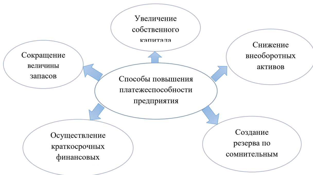
Рисунок 2. Способы повышения платежеспособности предприятия

На рисунке 2 продемонстрированы основные способы, используемые при реализации целей по повышению, а также стабилизации финансовой устойчивости в различных российских предприятиях.