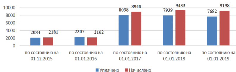
Рисунок 2. - Динамика поступлений торгового сбора на примере г. Москвы 5

торговый сбор эффективно действует только на территории г. Москвы, и взимается с 2015 года. Город Москва характеризуется тем, что на ее территории очень налаженная и развитая инфраструктура, поэтому введенный налог не приведет к сокращению хозяйствующих субъектов, и также не уменьшит число начинающих. Статистика поступлений от торгового сбора в местный бюджет города Москвы показывает, что с каждым его сумма только увеличивается (см. Рисунок 2).