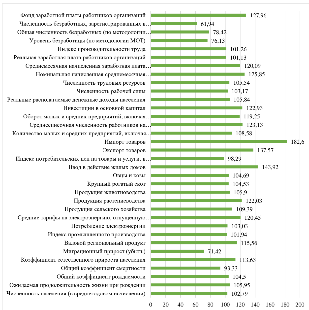
Рис. 1 Прогнозные показатели социально-экономического развития Республики Тыва на 2024 год

Для проведения прогноза социально-экономического развития Республики Тыва были проанализированы данные за 2021 г. и разработанный прогноз на 2024г.