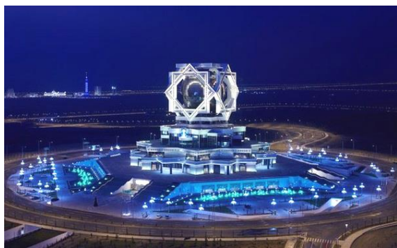
Рисунок 3. Дворец Бракосочетаний («Баг-тКошги»), г. Ашхабад, Туркмения