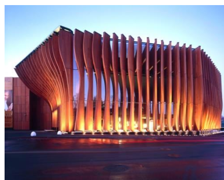
Рисунок 6. Концертный зал «БАРВИХА LUXURY VILLAGE», Москва, Россия

Также излюбленным местом проведения свадебных церемоний для москвичей стал загородный комплекс «Барвиха Luxury Village», с современным концертным залом позволяющим реализовать сценарии свадебного торжества любого масштаба и формата, так как рядом с отелем, открыт Московский областной Дворец бракосочетания, предоставляющий услугу государственной регистрации брака как гражданам России, так и резидентам других государств.