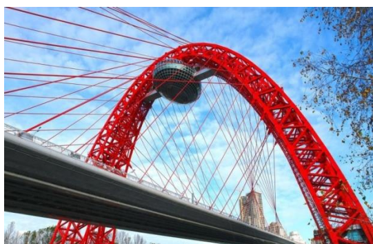
Рисунок 5. Дворец бракосочетания на Живописном мосту, Москва, Россия

Одним из таких решений было создание в 2013 г. Нового Дворца на Живописном мосту в Москве (рис. 5). При проектировании было принято неординарное решение – зал торжеств расположили в стеклянной капсуле, подвешенной к самой высокой части арочной конструкции моста.