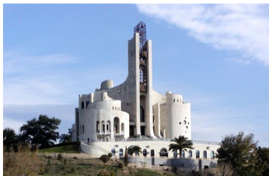
Рисунок 1. Дворец торжественных обрядов в Тбилиси, Грузия

сти эту работу Джорбенадзе к числу лучших произведений постмодернизма в СССР [2].