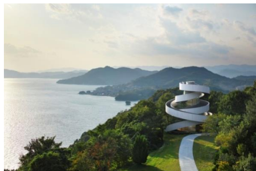
Рисунок 2. Часовня Ribbon Chapel, Хиросима, Япония

Самым же необычным и удивительным дворцом бракосочетания в мире можно назвать спиралевидную часовню в Японии Ribbon Chapel, возведенную на территории отеля Bella Vista Sakaigahama, японской префектуры Hiroshima, архитектор Hiroshi Nakamura (рис. 2) [3].