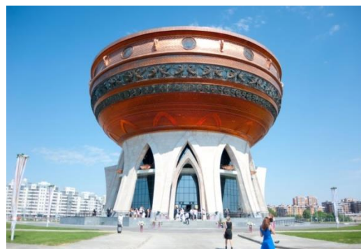
Рисунок 4. Центр семьи «Казан» - дворец бракосочетаний и смотровая площадка, г. Казань, Россия

Одиннадцатизэтажное здание ЗАГСА площадью более 38 тыс. м 2 представляет собой трехступенчатое сооружение, каждая сторона которого имеет вид восьмиконечной звезды. Внутреннее убранство Дворца выполнено в туркменском стиле, в состав центра входят шесть залов для торжественных регистраций брака, три свадебных зала для проведения праздничных мероприятий, два из которых рассчитаны на 500 и один на 1000 мест. Во Дворце также размещено семь банкетных залов, 36 магазинов, два кафе, пункты оказания всех необходимых свадебных услуг, салоны свадебной одежды, свадебного оформления автомашин, проката ювелирных изделий, национальных украшений, фотосалон и салон красоты, гостиница на 22 комфортабельных номера. На третьем и четвертом этажах – административные помещения и архив. Под зданием находится автостоянка на 300 машин [4].