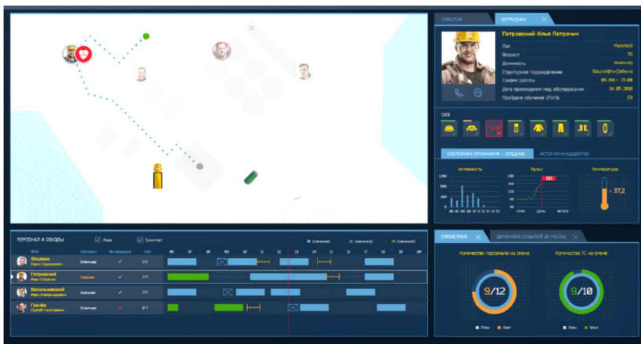
Рисунок 1. Интерфейс информационных систем мониторинга передвижения и состояния здоровья работников.

3. устройство способно определять местоположение, и отсутствие сотрудников на рабочем месте при работе на удаленной станции легко проконтролировать.