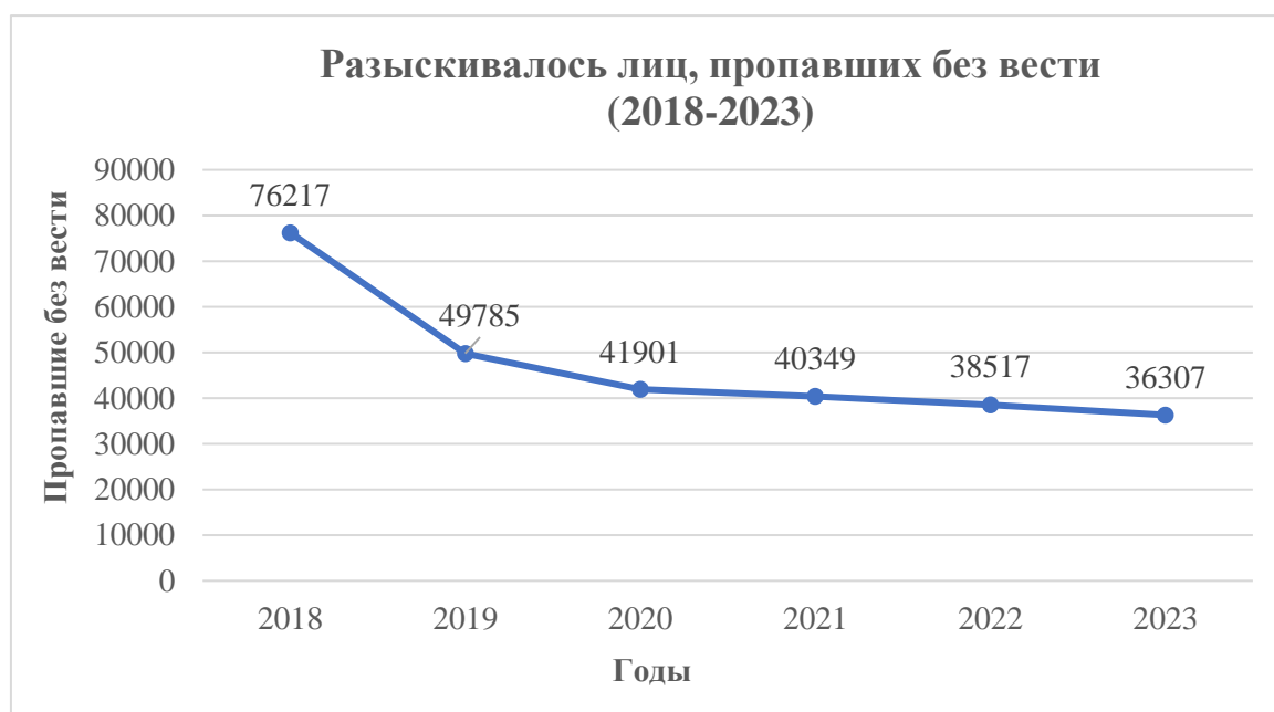
Рисунок 1. Статистика, представленная МВД РФ, по розыску лиц, пропавших без вести, за период 2018–2023 г.

Статистика найденных выглядит следующим образом: