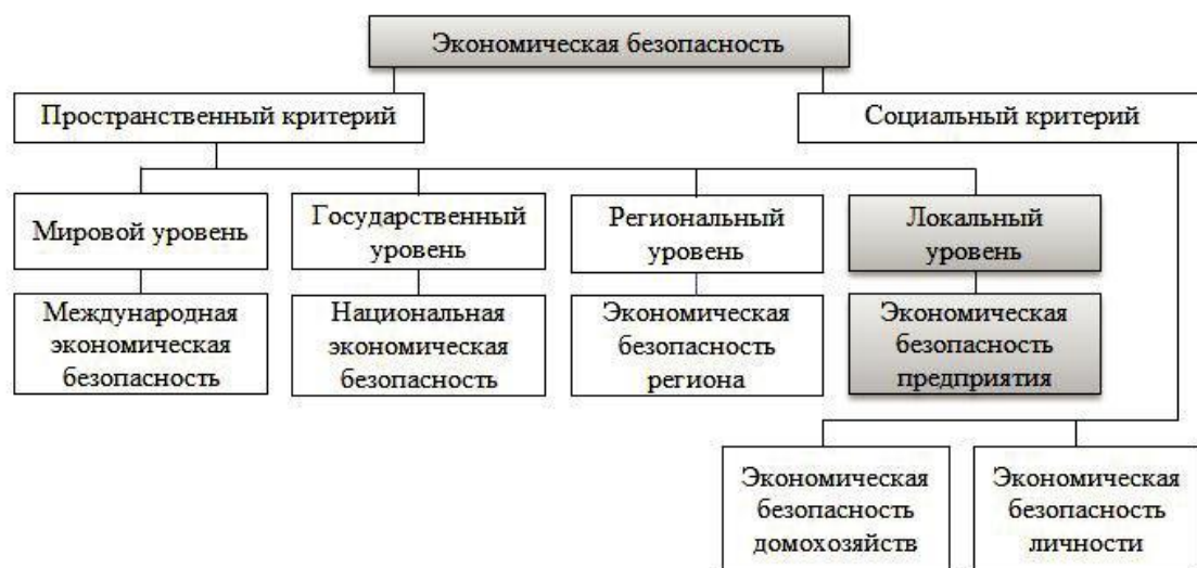
Рис 1 - Экономическая безопасность как часть общей системы обеспечения экономической безопасности.

Развитие экономики на современном этапе требует от организаций в процессе управления экономической деятельностью уделять серьёзное внимание различным сторонам экономической безопасности, в том числе: управлению и минимизации экономических рисков, правильности ведения бухгалтерского и налогового учета, борьбе с внешним и внутренним мошенничеством, проверке благонадежности и платежеспособности партнеров перед вступлением с ними в гражданско-правовые отношения, отсутствию различного рода штрафных санкций по результатам проверок контролирующих органов. Эта проблема усугубляется сокращением бюджетного финансирования ряда государственных организаций, возникают определенные проблемы, связанные с отсутствием механизма страхования экономического риска принятия неверных управленческих решений и недобросовестном исполнении работниками предприятия своих обязанностей.