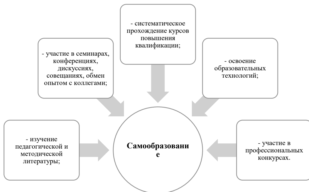
Рисунок 2 - Виды деятельности для самообразования учителей 14

Срок реализации плана самообразования определяется самим преподавателем. Этот процесс обычно происходит в 4 основных этапа.