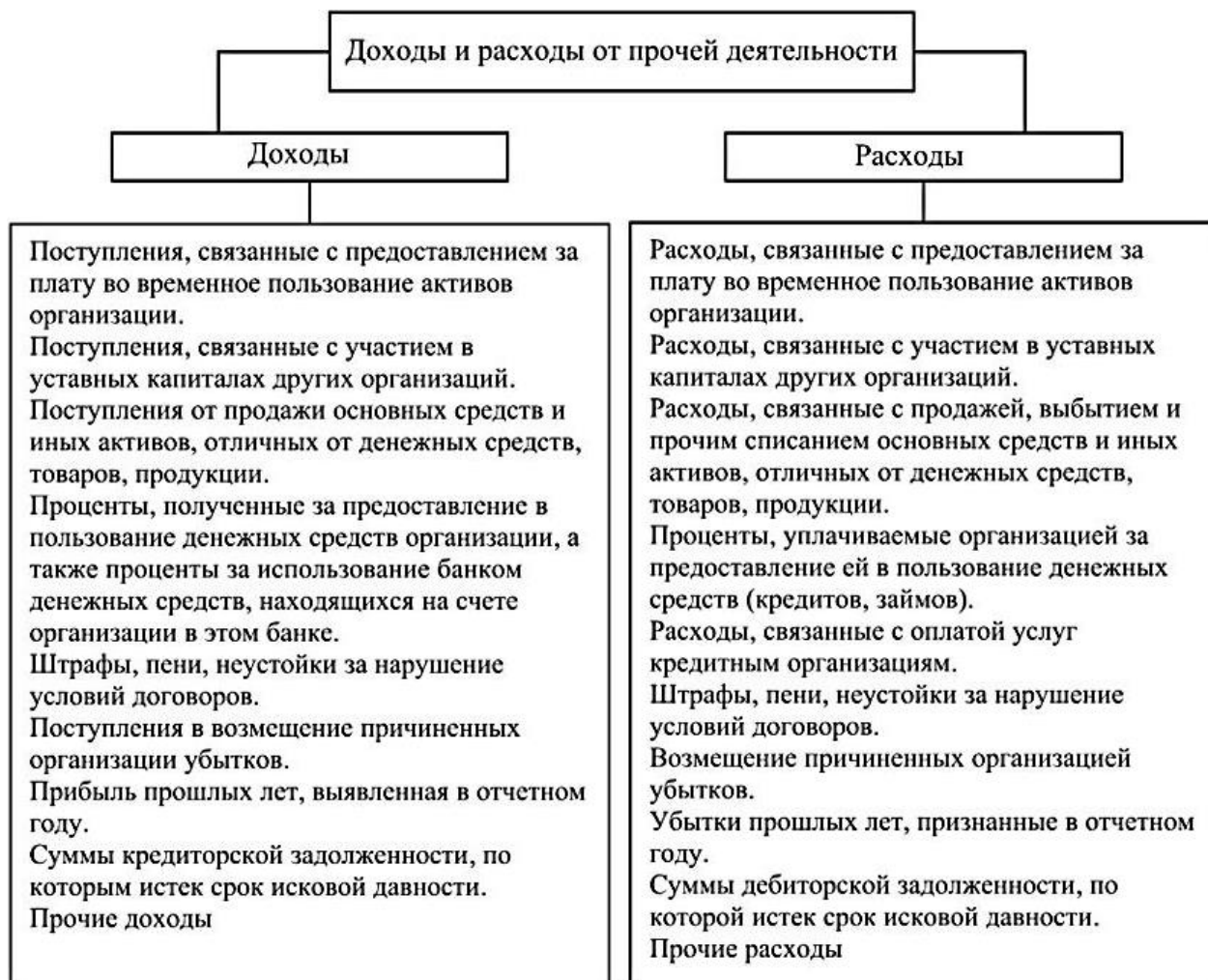
Рисунок 1. Классификация прочих доходов и расходов сельскохозяйственного предприятия для целей аудита

Несомненно, прибыль, полученная предприятием, напрямую характеризует достигнутый ею финансовый результат, однако истинную роль и значение данной финансовой категории сложно оценить в рамках современной экономики.