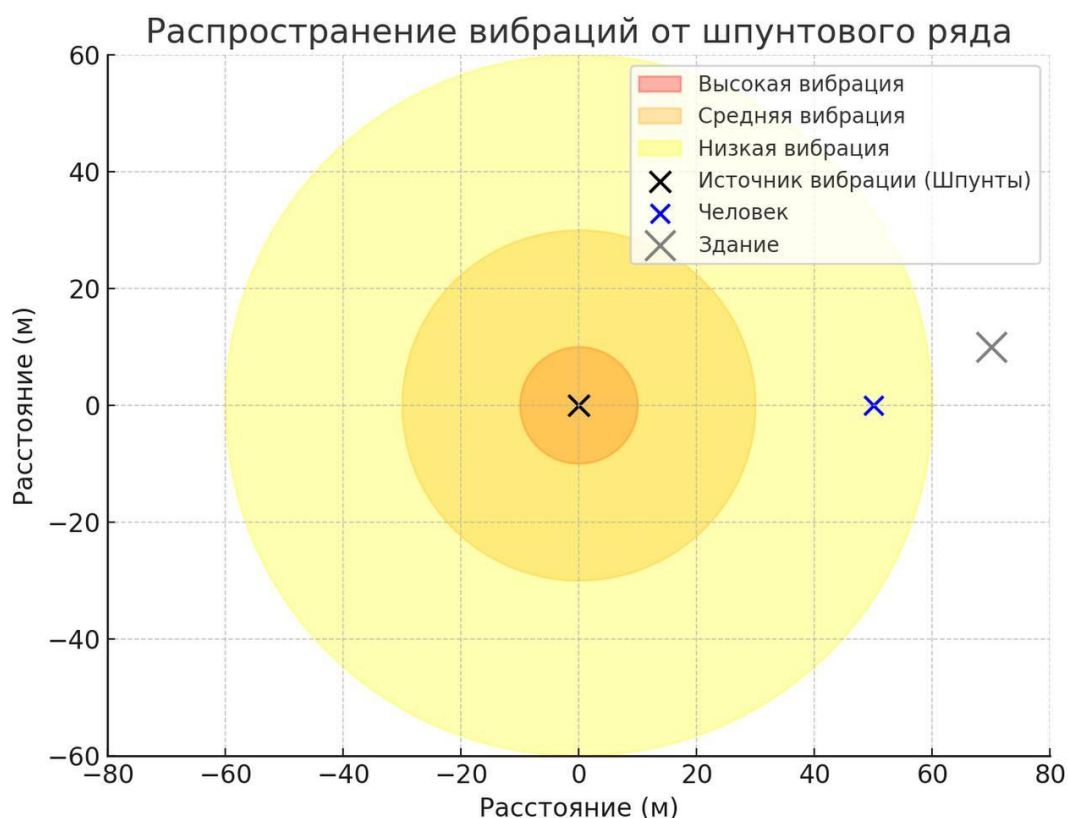
Рисунок 1 – Распространение вибрационных волн при забивке шпунта (рисунок автора)

Для оценки влияния вибрации представим данные об ориентировочных допустимых уровнях воздействия в таблице 1.