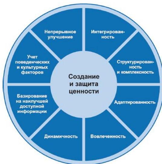
Рисунок 2. Принципы менеджмента риска

После проведения анализа системы управления рисками на предприятии ПАО "Уралмашзавод", можно утверждать, что все документы, разработанные в рамках данной системы, соответствуют унифицированным стандартам и регламентам. Однако, важно отметить, что эффективность