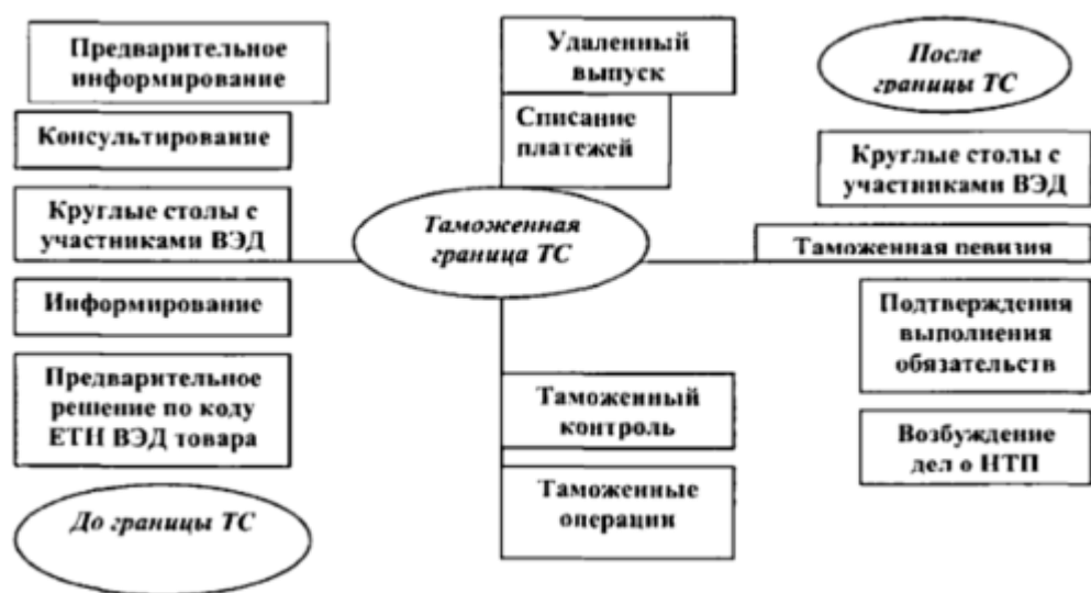
Рис.2. Взаимодействие таможенных органов и участников ВЭД при перевозке грузов

К наиболее важным направлениям развития эффективного взаимодействия таможенных органов и других участников ВЭД можно отнести: